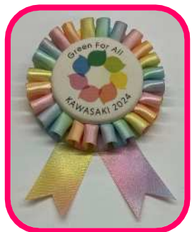
フェアコサージュ