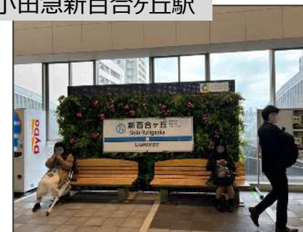
小田急新百合ヶ丘駅